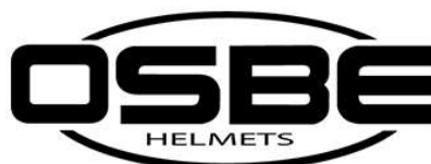
TABELLA TAGLIE - SIZE CHART CASCHI MOTO - MOTORBIKE HELMETS

La misura in centimetri corrisponde alla taglia nominale. Per misurare la circonferenza occorre posizionare un metro da sarta 2 cm sopra le orecchie e a circa metà fronte. Attenzione: E' normale che il casco da nuovo risulti lievemente stretto, con l'utilizzo la calzata tende a diventare più comoda.