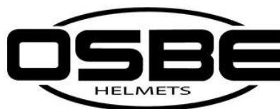
TABELLA TAGLIE - SIZE CHART CASCHI SCI/SNOW - SKI/SNOW HELMETS

La misura in centimetri corrisponde alla taglia nominale. Per misurare la circonferenza occorre posizionare un metro da sarta 2 cm sopra le orecchie e a circa metà della fronte. Attenzione: E' normale che il casco da nuovo risulti lievemente stretto, con l'utilizzo la calzata tende a diventare più comoda.